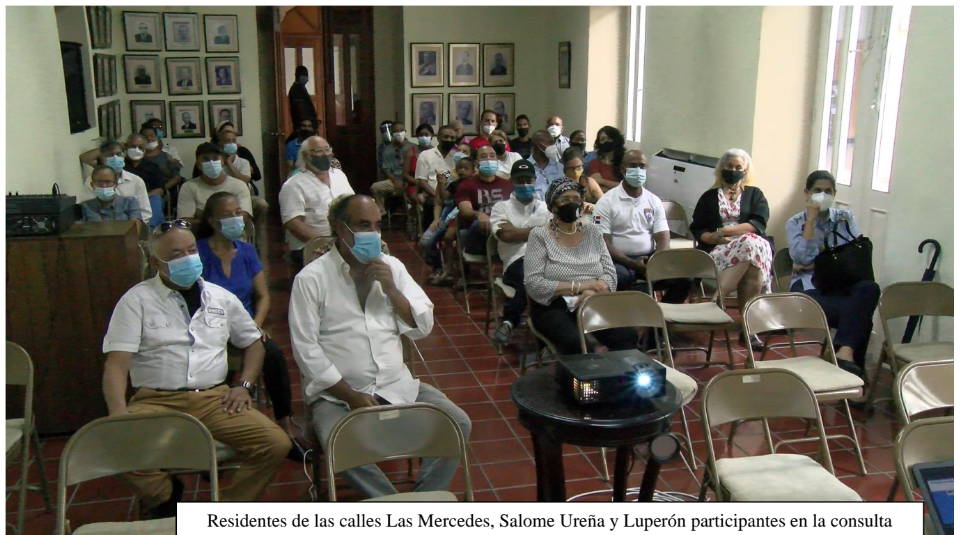
Residentes de las calles Las Mercedes, Salome Ureña y Luperón participantes en la consulta